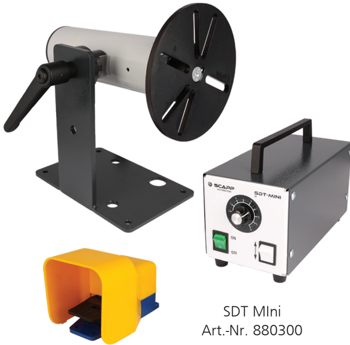
SDT Mini Art.-Nr. 880300