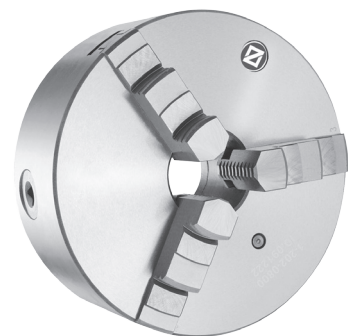
Dreibackenfutter Art.-Nr. 880500.G160